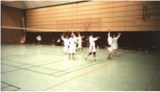
hofes konnte so richtig ausgelassen gefeiert werden.